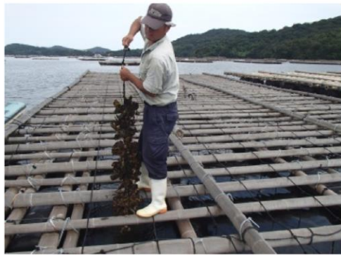
『順調に成長しています。』 -牡蠣を確認する7代目-

現在は、今年の5月に種付けした牡蠣筏を瀬戸内市虫明湾内に設置しています。これから台風シーズンを無事に過ごすことが出来た9月下旬頃から、プランクトンの豊富な潮通しの良い外海(小豆島が見える辺り)に、牡蠣筏を移動させます。季節の変化と共に海水の温度が下がり、牡蠣の成長に優れた時候に近づくと、身の引き締まったブランド曙牡蠣へと大きく育って行きます。皆さまに牡蠣をお渡し出来る日まで、時候の様子を見ながら大切に牡蠣を育てています。