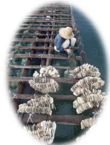
来年出荷予定の牡蠣の種